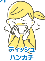
ティッシュ ハンカチ